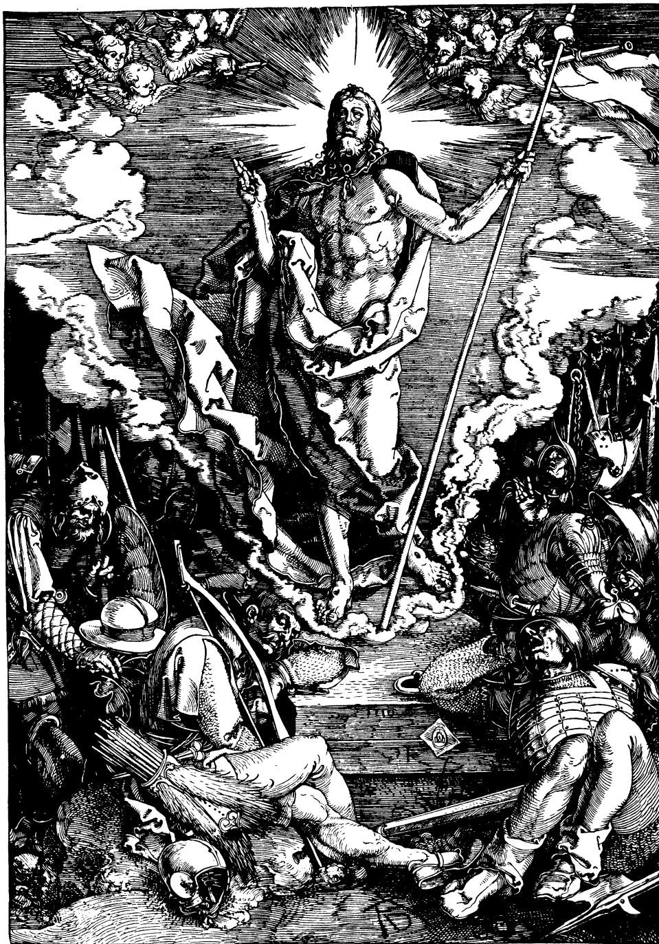
Woodcut, THE RESURRECTION OF CHRIST, 1510. Albrecht Dürer.